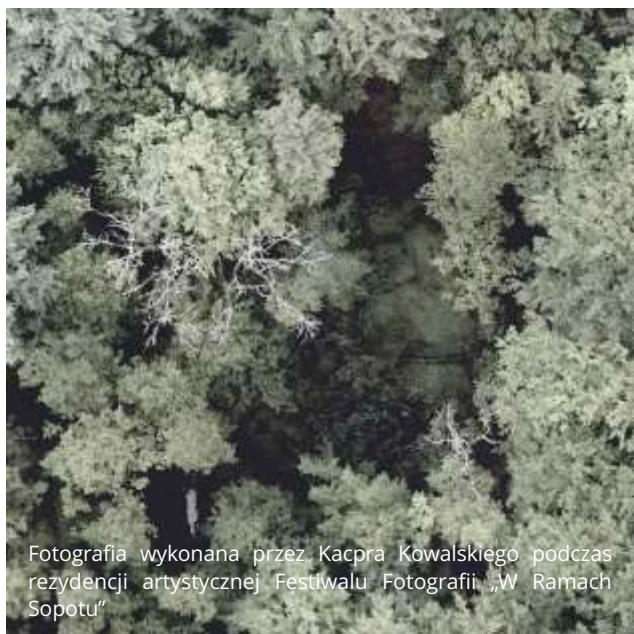
Fotografia wykonana przez Kacpra Kowalskiego podczas rezydencji artystycznej Festiwalu Fotografii „W Ramach Sopotu”

Na festiwal co roku zapraszani są najważniejsi polscy artyści fotografii, z którymi uczestnicy mogą się spotkać podczas wystaw, wieczorów autorskich czy też warsztatów. Festiwal Fotografii „W Ramach Sopotu” zagości w mieście od 7 do 9 września.