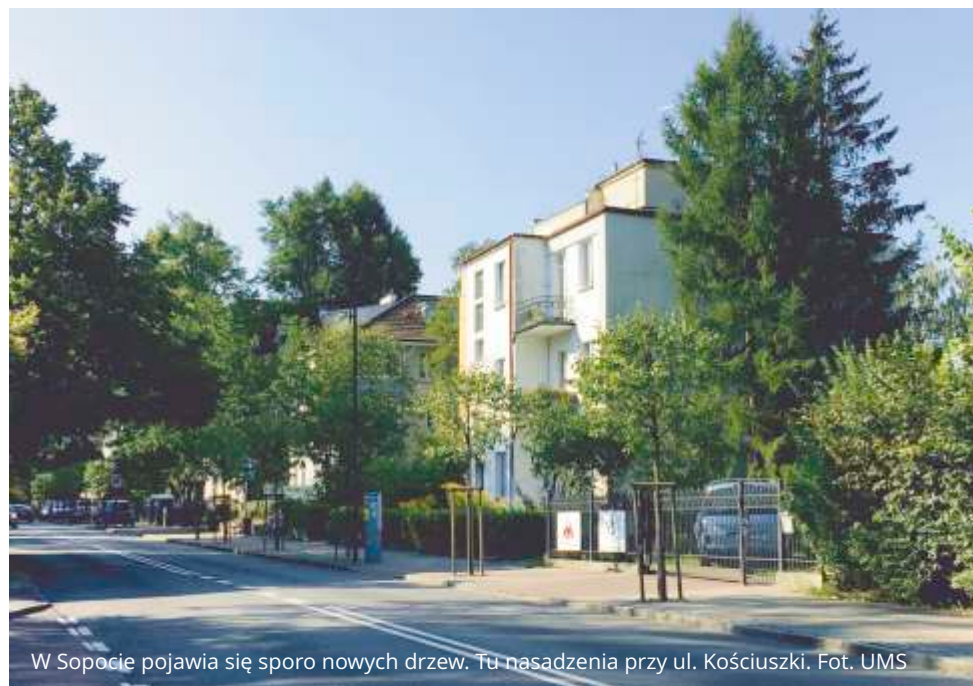
W Sopocie pojawia się sporo nowych drzew. Tu nasadzenia przy ul. Kościuszki.

Wycinka drzew i nasadzenia nowych zostaną wykonane do końca 2018 r. W kolejnym roku w planach jest przedłużenie lipowego szpalera w kierunku osiedla Kraszewskiego.