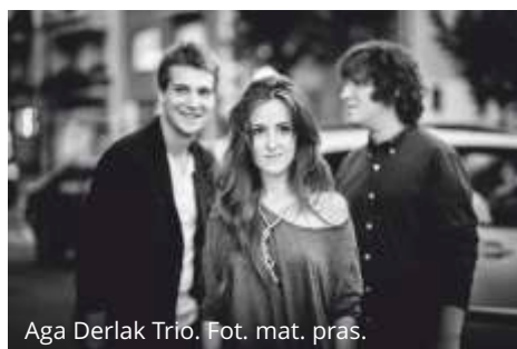
Aga Derlak Trio.

Więcej informacji: www.jazwolności.pl . Wstęp jest wolny.