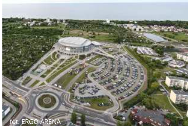
fol. ERGO ARENA

Parking będzie działał od 26 czerwca do 23 sierpnia (z wyłączeniem 1 i 8 lipca, kiedy odbywają się imprezy w ERGO ARENIE).