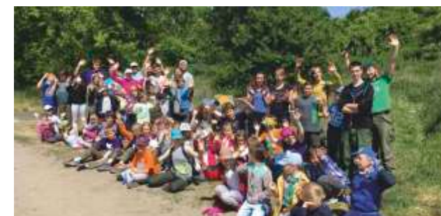
Młodzi ludzie sprzątaли m.in. dojsćcie do ERGO ARENY (ul. Łokietka). Fot. mat. pras.

Dzieci i młodzież skupiona w sopockich organizacjach, pracowały na terenie miasta dbając o czystość i porządek, a w zamian otrzymały nagrody finansowe przeznaczone na organizację wypoczynku wakacyjnego. W konkursie wzięło udział 958 osób z 34 organizacji, które od marca do czerwca sprzątały tereny zielone Sopotu. Przyznane nagrody uzależnione były od liczebności grupy wykonującej prace i wynosiły od 600 zł (dla grupy liczącej 10 osób) do 1 200 zł (dla grupy liczącej 20 osób).