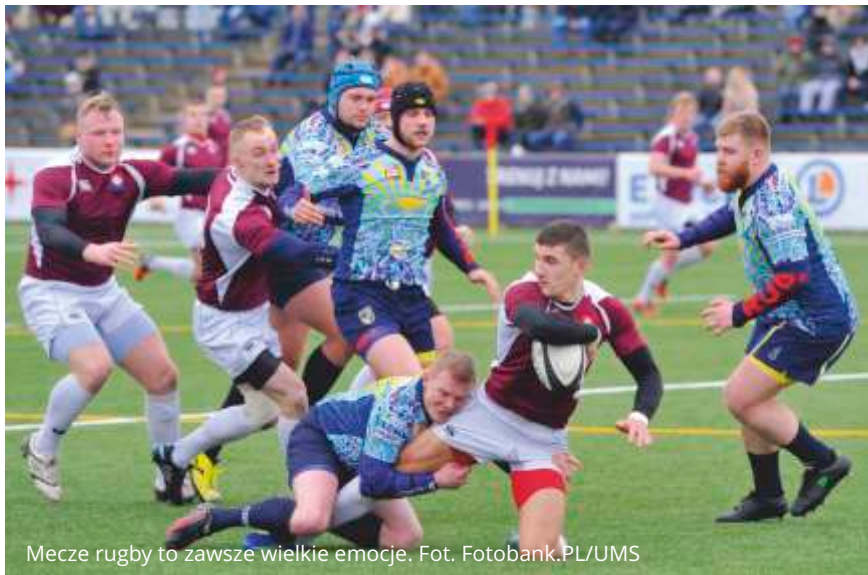
Mecze rugby to zawsze wielkie emocje.

Na stadionie rugby im. Edwarda Hodury (ul. Jana z Kolna 18) w sobotę, 4 listopada, o godz. 17.30 odbędzie się mecz na szczycie ekstraklasy pomiędzy Ogniwem Sopot i Master Pharm Budowlanymi Łódź. Sopotcy rugbiści zajmują drugie miejsce w tabeli, Budowlani z Łodzi plasują się na pozycji pierwszej.