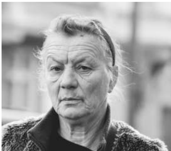
Jedna z prac Magdaleny Małyjasiak.

Sama autorka tak pisze o projekcie: „Prezentowany w Muzeum Sopotu reportaż, a także portrety, to próba przedstawienia ich codzienności. Podczas pracy przy tym projekcie miałam przyjemność poznać osoby, których pewnie w innych okolicznościach nie byłoby mi dane poznać. Chciałam, aby moje fotografie stały się swoistym oknem, przez które widz może zobaczyć osoby z doświadczeniem bezdomności takimi, jakie są. Mam nadzieję, że takie przedstawienie codzienności osób będących częścią społeczności Sopotu pozwoli przyjrzeć się negatywnym stereotypom dotyczącym bezdomności”.