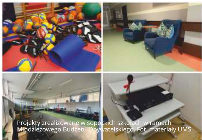
Projekty zrealizowane w sopockich szkołach w ramach Młodzieżowego Budżetu Obywatelskiego.