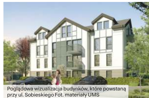
Poglądowa wizualizacja budynków, które powstaną przy ul. Sobieskiego

– Na tym nie koniec dobrych wiadomości. Trwa bowiem budowa 49 mieszkań przy ul. Jana z Kolna – mówi Magdalena Czarzyńska-Jachim, prezydentka Sopotu . – Oznacza to, że w różnym stadium realizacji jest obecnie 112 nowych lokali komunalnych. Budujemy przede wszystkim z myślą o młodych mieszkańcach oraz o osobach, które tutaj pracują i chcą wiązać swoją przyszłość z kurortem.