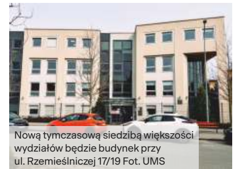
Nową tymczasową siedzibą większości wydziałów będzie budynek przy ul. Rzemieślniczej 17/19

Aby zapewnić ciągłość obsługi, w trakcie przeprowadzki w siedzibie przy ul. Kościuszki 25/27 będą dyżurować pracownicy przenoszonego wydziału.