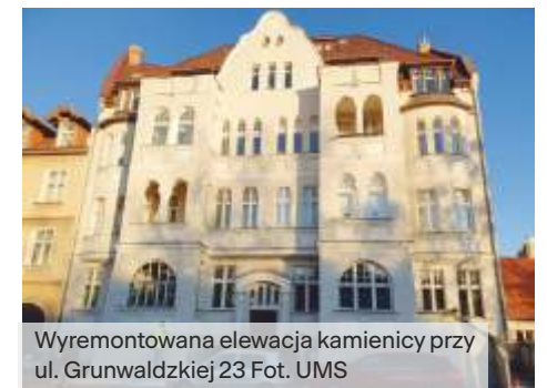
Wyremontowana elewacja kamienicy przy ul. Grunwaldzkiej 23

i wspólnot w ważnych, a często niezwykle kosztownych pracach przy substancji zabytkowej – mówi Magdalena Cieślak, wiceprezydentka Sopotu. – Cieszy mnie szczególnie duża liczba wniosków dotyczących renowacji historycznej stolarki – odnowionych zostanie aż 40 okien i 7 par drzwi. Sopot to miasto detalu, dlatego konsekwentnie dofinansowujemy też odtwarzanie rzeźb i dekoracji architektonicznych, które stanowią o unikalnym charakterze naszego kurortu.