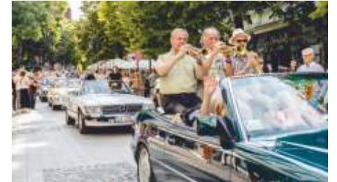
Ubiegłoroczny przemarsz muzyków jazzowych ul. Boh. Monte Cassino. W tym roku jubileuszowa parada jazzowa przejdzie przez Sopot 8 sierpnia.

Sopot Jazz Festival, którego korzenie sięgają roku 1956, kiedy w Sopocie odbył się pamiętny Festiwal Muzyki Jazzowej, świętuje w tym roku jego 70. rocznicę. Edycja 2026 zapowiada się więc naprawdę wyjątkowo.