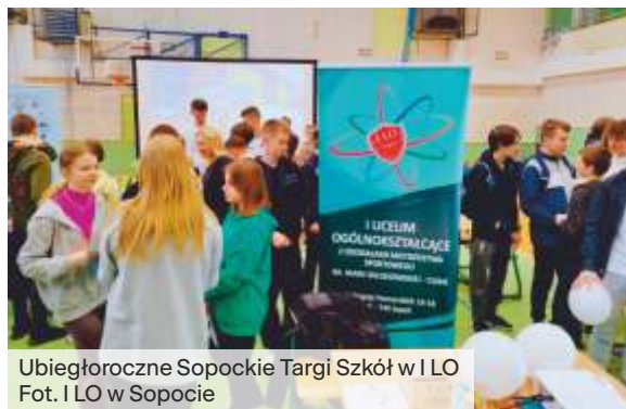
Ubiegłoroczne Sopockie Targi Szkół w I LO

W piątek, 10 kwietnia 2026 r. od godz. 10.00 w auli I Liceum Ogólnokształcącego przy ul. Książąt Pomorskich 16/18 rozpoczyna się Sopockie Targi Szkół Ponadpodstawowych .