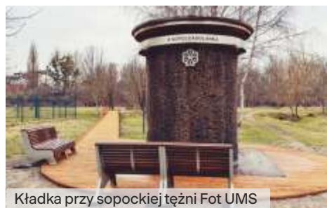
Kładka przy sopockiej tężni

Na mieszkańców i turystów odwiedzających Sopockie Błonia czeka nowa infrastruktura rowerowa oraz kładka prowadząca do tężni solankowej, a tuż obok, przy Ergo Arenie powstał pumtrack.