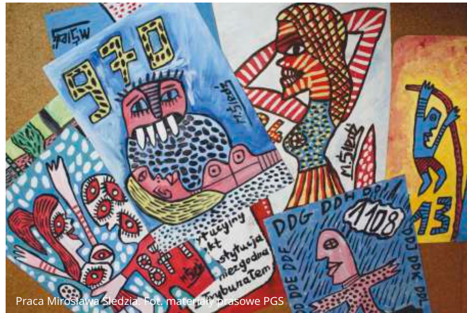
Praca Mirosława Śledzia.

Na ekspozycję składa się 130 prac Mirka Śledzia, gdyńskiego artysty, którego dzieła były prezentowane w Muzeum Sztuki Współczesnej MOCAK w Krakowie, Centrum Sztuki Współczesnej Łaźnia w Gdańsku czy też w Państwowej Galerii Sztuki w Sopocie w ramach wystawy „Palindrom” w 2015 r.