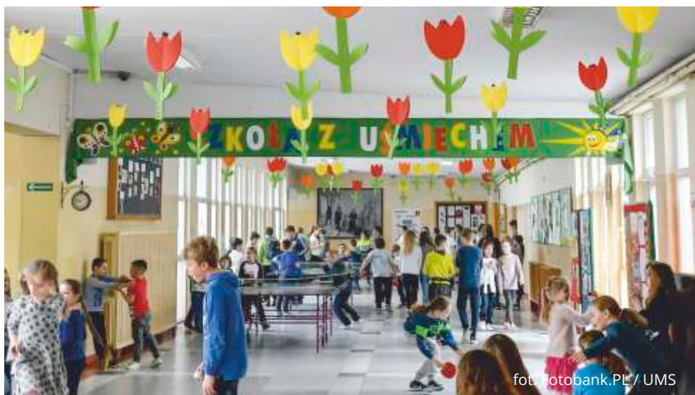
Sopockie szkoły realizują wiele dodatkowych obowiązkowych i pozalekcyjnych zajęć.