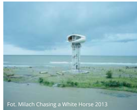
Chasing a White Horse 2013