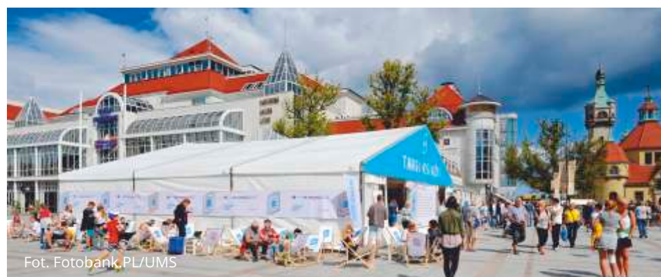
Festiwal Literacki Sopot co roku przyciąga rzesze miłośników książki.