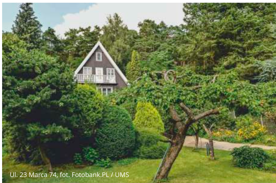
Ul. 23 Marca 74, fot. Fotobank.PL / UMS