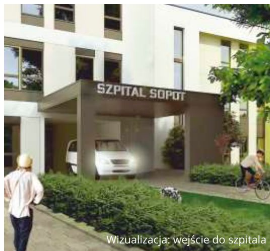
Wizualizacja: wejście do szpitala

Starania Sopotu o szpital dla osób starszych zakończyły się sukcesem. Dzięki pieniądzą z Unii Europejskiej i niemałym środkom pochodzącym z budżetu miasta, już wkrótce zbudowane zostanie centrum, w którym osoby starsze znajdą profesjonalną opiekę. Nowoczesna aparatura medyczna, oddziały dzienne, sieć poradni oraz system szkoleń będą, dzięki szpitalowi, lepiej dostępne dla potrzebujących, starszych osób. Profilaktyka, a gdy trzeba sprawne leczenie, wpłyną na poprawę komfortu życia seniorów i ich rodzin.