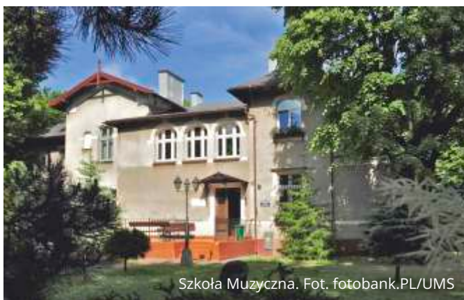
Szkoła Muzyczna.

Dodatkowo Gmina wyda około 500 tys. zł na dostosowanie szkół do nowej sieci szkół w związku z reformą oświaty.