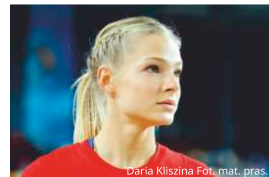
Daria Kliszina

Na bieżniach i rozbiegach będziemy mogli podziwiać sportowców ze Stanów Zjednoczonych, Kenii, Trynidadu Tobago, Kataru, Jamajki, Kuby, Nowej Zelandii, Republiki Południowej Afryki czy Brazylii. Wystąpią także utytułowani zawodnicy z Europy – mistrzowie i rekordziści kraju, medaliści imprez rangi światowej. Polskę reprezentować będą: Konrad Bukowiecki (pchnięcie kulą), Angelika Cichocka (biegi średnie), Joanna Józwiak (biegi), Sofia Ennaoui (biegi), Ewa Swoboda (sprint), Anna Kielbasińska (sprint) i wielu innych. Na Stadionie Leśnym pojawi się także Daria Kliszina – wielokrotna medalistka imprez o zasięgu światowym, ogłoszona przez dziennikarzy najładniejszą i najbardziej fotogeniczną zawodniczką Igrzysk Olimpijskich w Rio de Janeiro 2016. Daria występuje pod neutralną flagą IAAF.