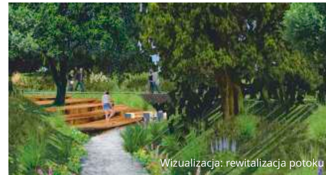
Wizualizacja: rewitalizacja potoku