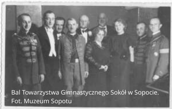
Bal Towarzystwa Gimnastycznego Sokół w Sopocie.