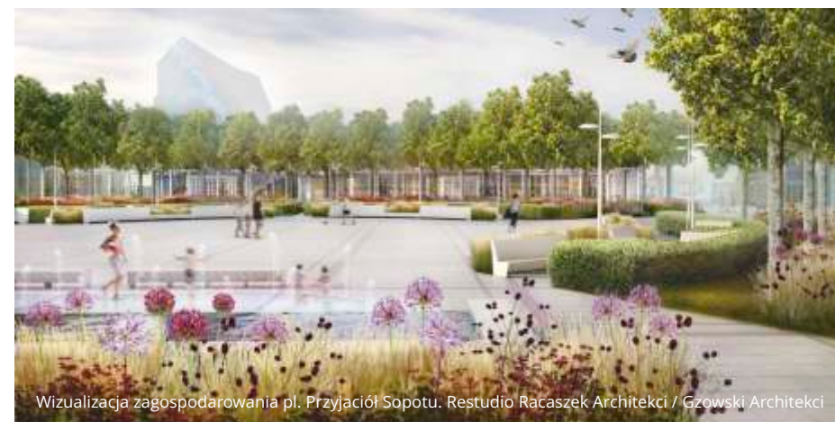
Wizualizacja zagospodarowania pl. Przyjaciół Sopotu. Restudio Racaszek Architekci / Gzowski Architekci

Sopot zaprezentował nową koncepcję aranżacji placu Przyjaciół Sopotu. Będzie więcej zieleni, kwiatów i przestrzeni zachęcającej do spędzania czasu w tym miejscu. Podczas spotkania online zespół architektów – autorzy nowej koncepcji, przedstawił wszystkie zmiany, które czekają najważniejszy plac miejski.