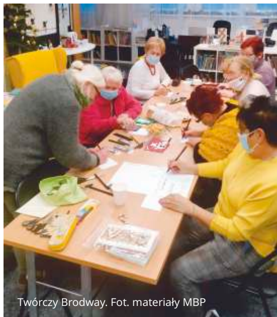
Twórczy Broadway.

20 grudnia w filii Broadway (Oskara Kolberga 9) odbędzie się kolejne spotkanie warsztatowe „Twórczy Broadway” – rękodzielo dla dorosłych. Warsztaty odbywają się w poniedziałki o godz. 15.00. Na zajęciach spotykają się ludzie, których łączy pasja do sztuki i radość z tworzenia. Uczestnicy rozwijają swoje umiejętności twórcze i rozwijają zdolności manualne i artystyczne. Do pracy wykorzystywane są najczęściej materiały takie jak papier, karton, różne ozdoby, a także wszelkiego rodzaju kleje czy farby.