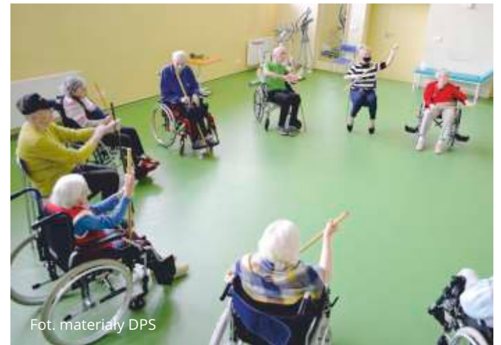
Fot. materiały DPS

Szczegółowe informacje o zasadach kierowania do DPS: Dział Pomocy Instytucjonalnej i Rehabilitacji Społecznej MOPS Sopot, ul. Kolejowa 14, tel. 58 551 17 10 wew. 232, 236.