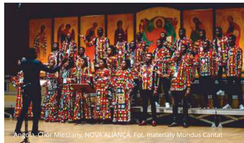
Angola, Chór Mieszany, NOVA ALIANÇA.

18. edycja Międzynarodowego Festiwalu Chóralnego Mundus Cantat odbędzie się w dniach 21-29 maja. Do Sopotu przyjedzie 13 zespołów z całego świata, m.in. z Angoli, Filipin, Łotwy