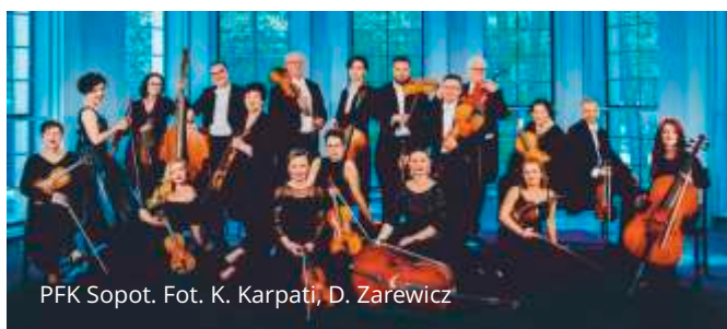
PFK Sopot.

Myślą przewodnią 14. edycji Festiwalu jest #natura. Każdy z koncertów na swój sposób odwołuje się będzie do hasła przewodniego. Ta wyjątkowa edycja festiwalu ma na celu pobudzić publiczność do aktywnego słuchania, do świadomego uczestnictwa w koncertach poprzez poszukiwanie odgłosów natury. Celem edycji #natura jest również pobudzenie wyobraźni – tego wspaniałego, przyrodzonego człowiekowi narzędzia, za pomocą którego potrafimy czynić nasz świat miejscem jeszcze piękniejszym. Więcej informacji na stronie www.sopotclassic.pl .