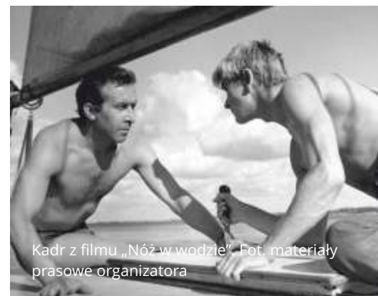
Kadr z filmu „Nóż w wodzie”.

Projekcja 22 maja to będzie kultowe kino dalekiego wschodu, czyli „Upadłe Anioły” Wong Kar Waia. Bohaterami filmu z 1995 r. są mieszkańcy Hongkongu, mrocznej, hipnotycznej metropolii i jej zaułków. Obrazowi towarzyszy muzyka zespołu Massive Attack. W klimat filmu wprowadzi widzów DKF Tomasz Garstkowiak.