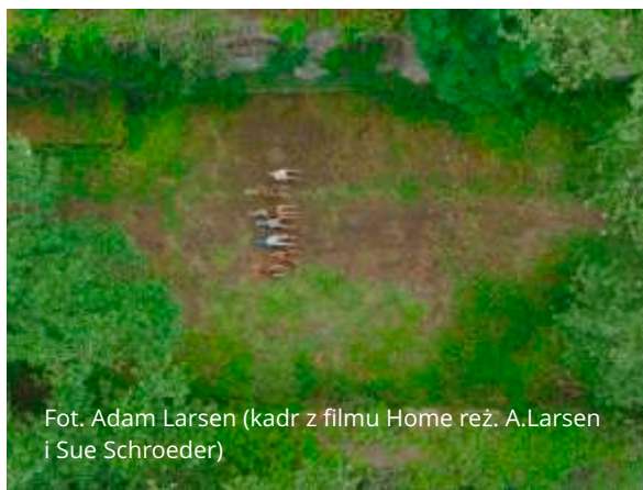
Fot. Adam Larsen (kadr z filmu Home reż. A.Larsen i Sue Schroeder)

W dniach 13-19 maja odbędzie się Festiwal Rozproszony Between.Pomiędzy oraz towarzysząca mu konferencja „Teatr – Literatura – Zarządzanie”. Wydarzenia festiwalowe obejmą kampus Uniwersytetu Gdańskiego, Instytut Kultury Miejskiej w Gdańsku, Gdański Teatr Szekspirowski, sopocki Teatr BOTO, a także okolice Wdzydz Tucholskich.