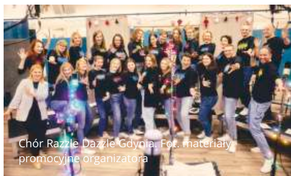
Chór Razzle Dazzle Gdynia.

To już tradycja, że każdego roku Sopot na kilka dni staje się polską stolicą chóralistyki. Fundacja Mundus Cantat z okazji jubileuszu przygotowała dla słuchaczy wiele muzycznych niespodzianek. Obok tradycyjnych Parady Chórów z Ceremonią Otwarcia, koncertów towarzyszących, przesłuchań konkursowych, Koncertu Finałowego odbędą się również dwa jubileuszowe koncerty.